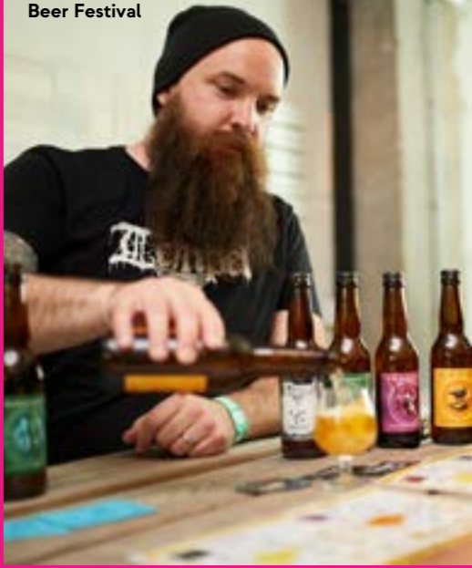
Leuven Innovation Beer Festival

meer info: www.visitleuven.be/bierfestivals