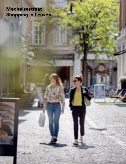
Mechelsestraat Shopping in Leuven