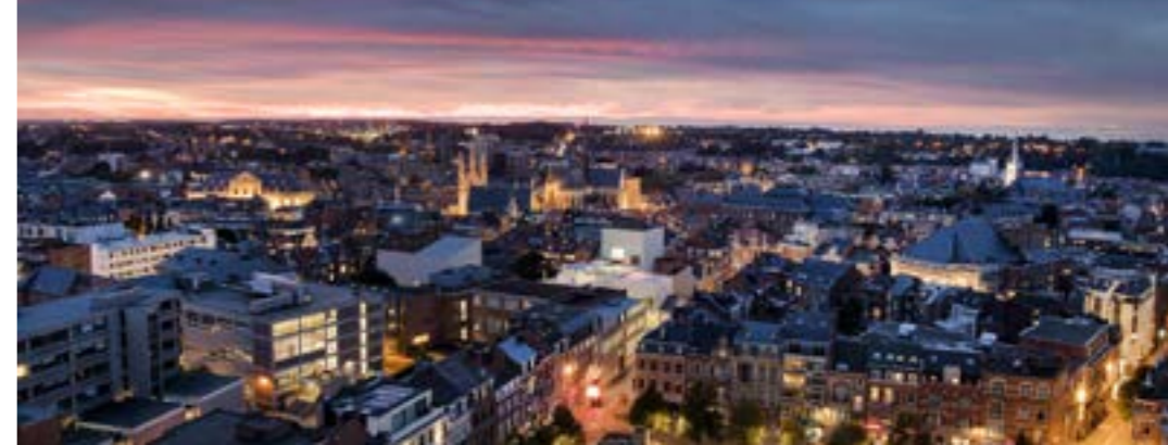
Universiteitsbibliotheek Uitzicht van op de toren

zo: 10:00 • start: J.P. Minckelersstraat 98 tickets: Visit Leuven & www.citiesbybike.be